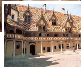
Links : Hotel Dieu in Beaune.