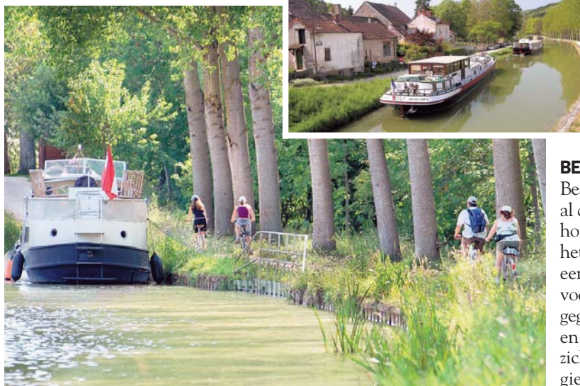
Het Canal du Bourgogne bekoort de fietslustigen.

een waar meesterwerk. De Vlaamse connectie in Beaune is geheel te danken aan Margaretha van Male, de vrouw van Filips de Stoute (14de eeuw). Zij haalde tal van Vlaamse kunstenaars en architecten naar Bourgondië. Beaune en het pittoreske Nuits-Saint-Georges hebben overigens een belfort, wat zeer uitzonderlijk is in deze streek. Even uniek is de abdij van Fontenay op zo'n 80 km ten noordoosten van Dijon. De Cisterciënzerabdij dateert uit de 12de eeuw en is geklasseerd als Unesco-werelderfgoed. Het complex is uitstekend gerestaureerd en bevat quasi alle originele gebouwen: kerk, klooster, slaappleatsen en tuinen. Fonte-